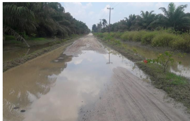
Gambar 1. Jalan Primer Kebun Bengabing PT.Fajar Agung Afd II