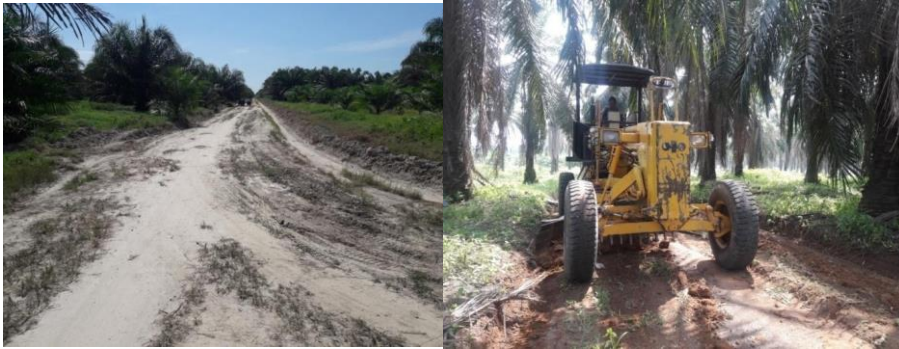
Gambar .2. Jalan Sekunder KebunBengabing PT.Fajar Agung Afd II

Berikut adalah gambar jalan Sekunder di Kebun Bengabing PT.Fajar Agung Afd II yang akan disajikan padagambar di bawah ini.